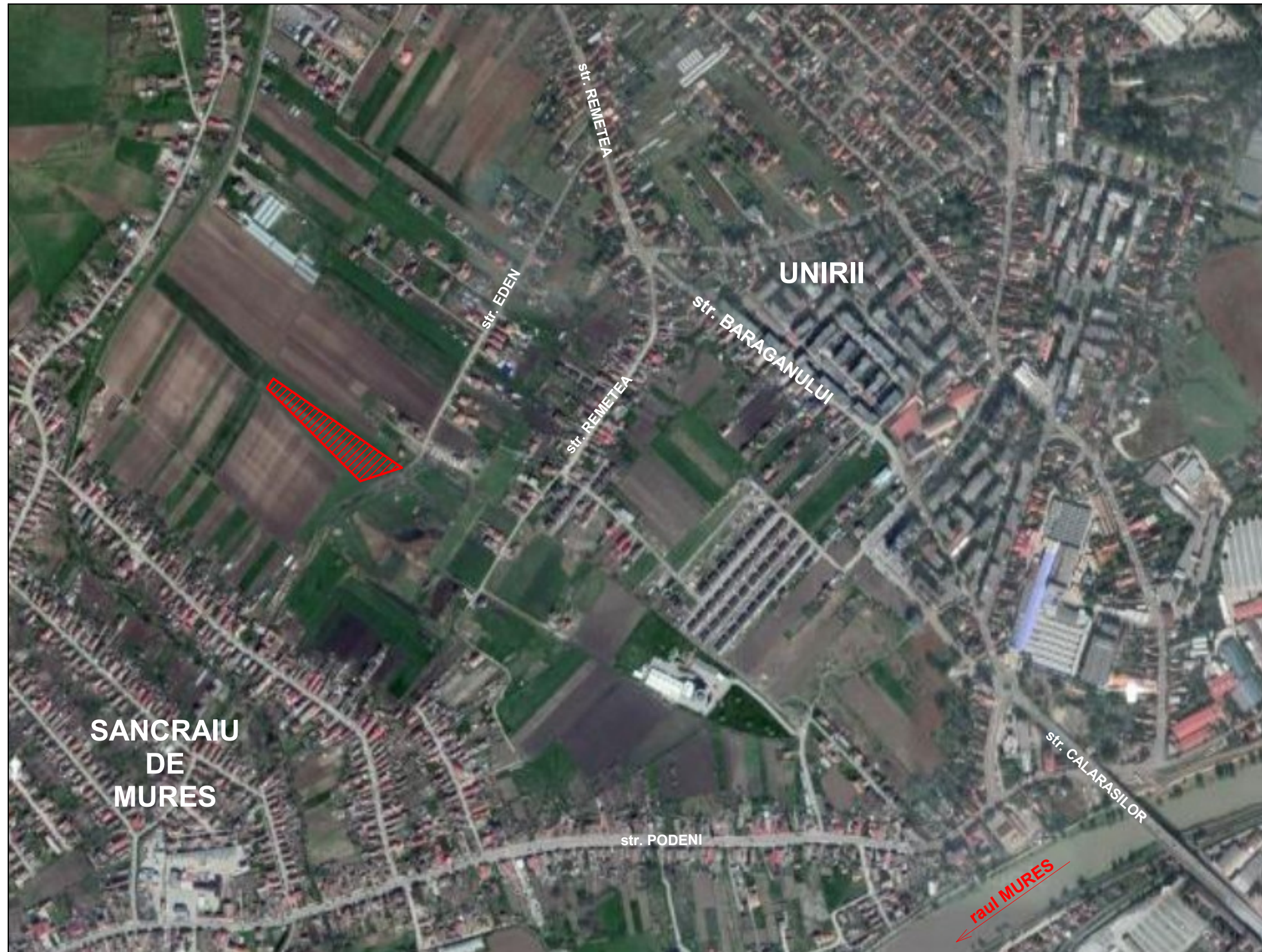
INCADRAREA IN ZONA

Acest document si informatiile pe care le contine pot fi utilizate exclusiv in scopul in care acesta a fost elaborat. Copierea, reproducerea sau utilizarea partiala sau integrala a prezentului document in alte scopuri este interzisa fara acordul scris din partea AIM PLANNERS S.R.L.-D. Documentul este valabil numai cu stampilele si semnaturile proiectantilor si verficatorilor in original. Prezenta documentatie este destinata exclusiv fazei proiectului evidentiata in cartus. Lucrarile de executie se vor realiza pe baza proiectului tehnic, faza PTH + DDE.